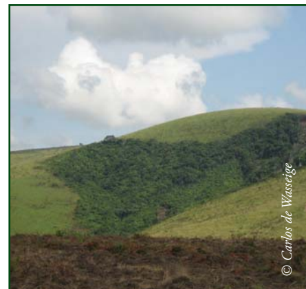
Photo 13.2 : Les lambeaux de forêt qui subsistent près des villes sont sous forte pression.