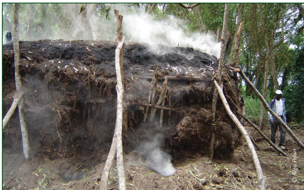
Photo 13.5 : Un four, dont l'activité peut durer plusieurs semaines.

terre (conversions agricoles, déforestation, gestion des forêts,). Des projets de plantations de palmiers à huile de grande ampleur existent, par exemple en RDC, avec des impacts sociaux et environnementaux encore mal définis. Néanmoins, un développement éventuel des cultures de biocarburants ne devrait pas avoir d'impact majeur direct sur la foresterie périurbaine et la disponibilité en bois énergie, les surfaces nécessaires à leur implantation se trouvant souvent en dehors des bassins d'approvisionnement. Selon la FAO, les pays en développement, dont ceux de l'Afrique centrale, devraient donner la priorité à une meilleure gestion de la ressource bois, en laissant les cultures énergétiques au second plan (risques sur l'accès à la terre et à la sécurité alimentaire).