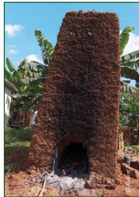
Photo 13.4 : La fabrication de brique est également une activité consommatrice de bois énergie.

La figure.13.1 présente un exemple de segmentation basée non seulement sur les exemples cités pour l'Afrique centrale, mais aussi sur l'analyse de situations dans d'autres régions et villes d'Afrique.