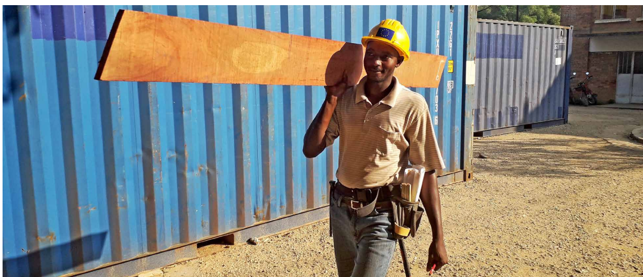
Ouvrier dans un chantier public de construction de l'Université de Kisangani, RDC

Contributeurs : Vincent Medjibé (4), Nicolas Bayol (5), Edouard Essiane Mendoula (1), Silvia Ferrari (1), Quentin Jungers (6), Florence Palla (7), Didier Bastin (8)