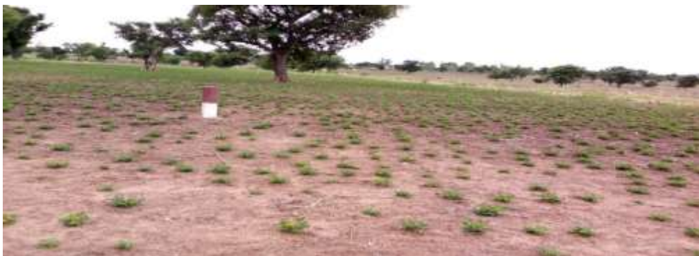
Figure 6: Une piste de transhumance matérialisée par des bornes, envahie par un champ d'arachides à Gouna.