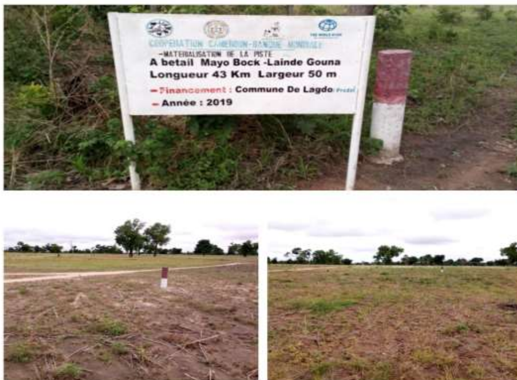
Figure 4: délimitation des pistes de transhumance à Laïndé-Gouna, commune de Lagdo

Dans ce contexte, les partenariats entre les cadres de concertation et les organisations publiques, privées et parapubliques ont permis de mettre en œuvre des infrastructures pastorales dans le bloc du Faro et les zones environnantes. L'objectif est de faciliter l'accès à l'eau, au fourrage hors du parc national, aux marchés à bétail de la région du Nord afin de réduire les conflits qu'engendre la transhumance. A titre d'exemple, une piste à bétail permettant de desservir l'axe de transhumance qui relie les communes de Lagdo, de Ngong et de Poli où on retrouve plusieurs marchés à bétail, a été tracée pour faciliter la fluidité de la transhumance et permettre aux transhumants en provenance du Nigeria, Niger, Tchad et RCA d'accéder non seulement à ces marchés, mais aussi aux zones légales de pâturages connues dans cette partie du Cameroun.