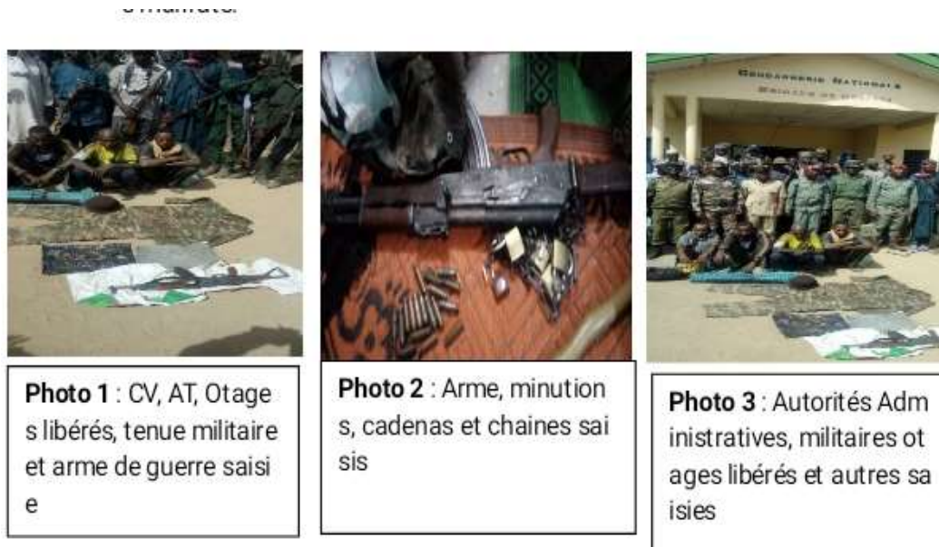
Figure 3: des munitions saisies et ravisseurs arrêtés par les groupes d'auto-défenses

malfaiteurs ou ravisseurs arrêtés sont contraints de jurer au nom du Coran et de renoncer à poser de tels actes. Cette démarche qui se sert du pardon vise à rétablir le lien entre auteurs des crimes et leurs victimes. L'objectif est d'amener les hors-la-loi à un changement de comportement et de perception des biens.