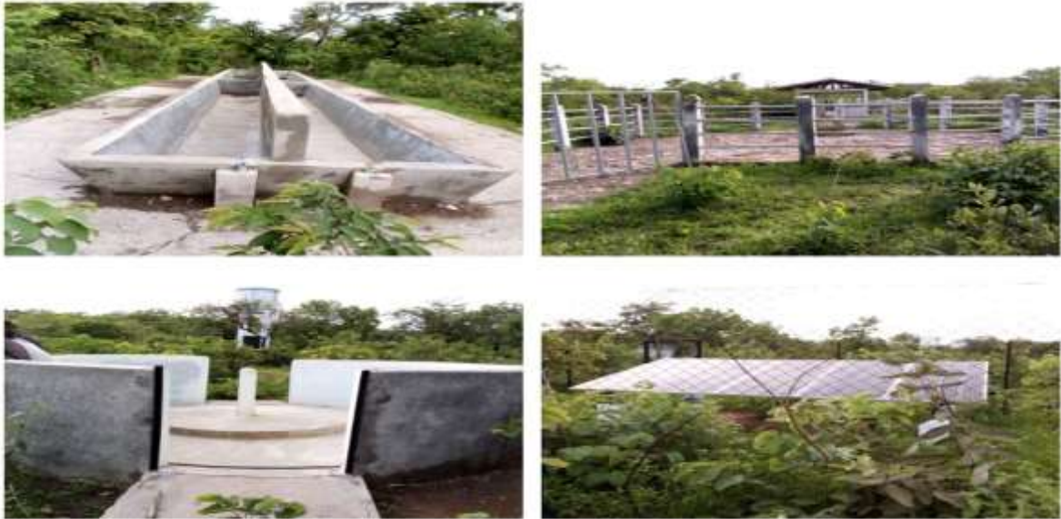
Figure 5: complexe pastoral de Laïndé-Gouna