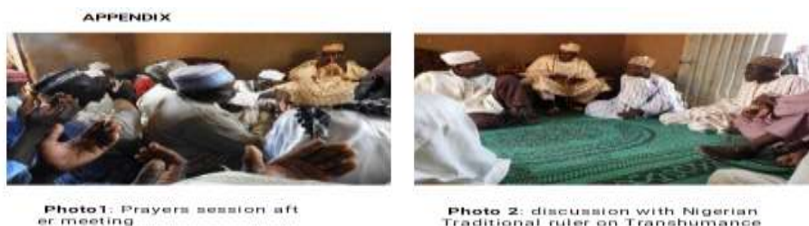
Figure 2 : Discussion entre les médiateurs et l'Emir du Bornou au Nigeria

La deuxième mission assignée au médiateur est la transmission fidèle et sans équivoque de l'information que lui a communiqué le service de conservation du PNF. En effet, le Tango team est porteur d'un message clair, relatif à la protection du PNF et à la lutte contre le braconnage dont les éleveurs transhumants sont le plus souvent auteurs 119 . Il s'agit d'une part d'influencer les habitudes culturelles de leurs confrères éleveurs à prendre conscience de l'importance de la protection de l'environnement, et d'autre part, de convaincre les autorités administratives et traditionnelles nigérianes et nigériennes de faire de la problématique de la transhumance transfrontalière et du phénomène de braconnage, des problèmes communs à ces Etats en vue d'une mutualisation des stratégies de réponses globales à l'échelle sous régionale pour la stabilisation de la sécurité. Dès lors la transmission de tel message, pour qu'il soit compris, mérite de recourir à un canal et outils de communications spécifiques, dans la mesure où l'environnement social dans lequel se déroule la médiation institutionnelle demande la maîtrise l'anthropologie culturelle endogène.